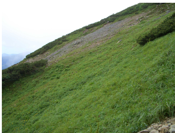
写真1 シカの過食圧による塩見岳における高山植生の変化(上:S54.7.30. 下:H17.7.27)