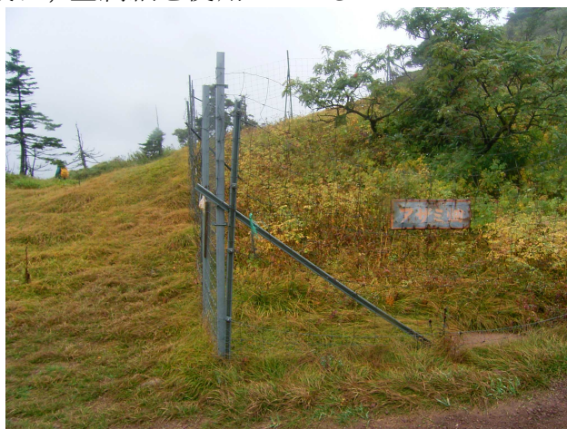
写真2 薊畑の防鹿柵

三伏峠では、ナイロン製のネットを実験的に使用した。軽く、安価、取り付けが容易というメリットがあるが、一方で、景観上の問題や、シカの角がネットに引っかかり、そのせいで柵が壊れてしまうという問題が生じた。また、積雪がなくなった後、すぐに柵の補修が必要であった。ボランティアによる活動が主であるため、タイミングよい補修作業は困難であるため、その後は、金属網を使用している。