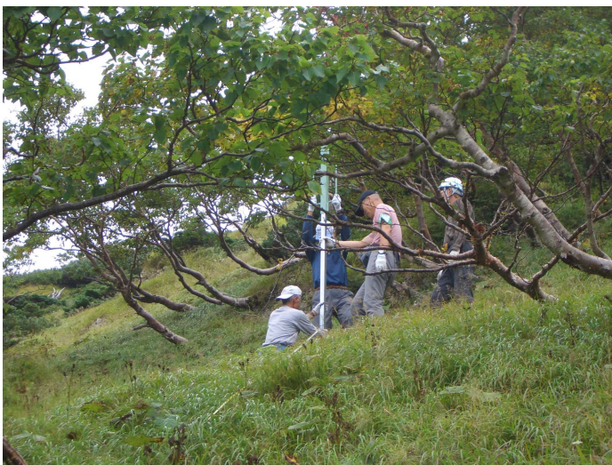
写真5 支柱の打ち込みの様子