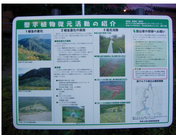
写真7 聖平小屋にある「植物復元活動の紹介」の看板

聖平の山小屋の屋外に、防鹿柵設置とそこでの植生復元活動についての解説をした掲示板を設けている(写真7)。