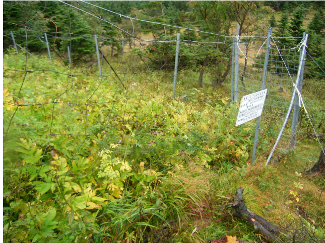
写真6 聖平での防鹿柵内外の植生の違い