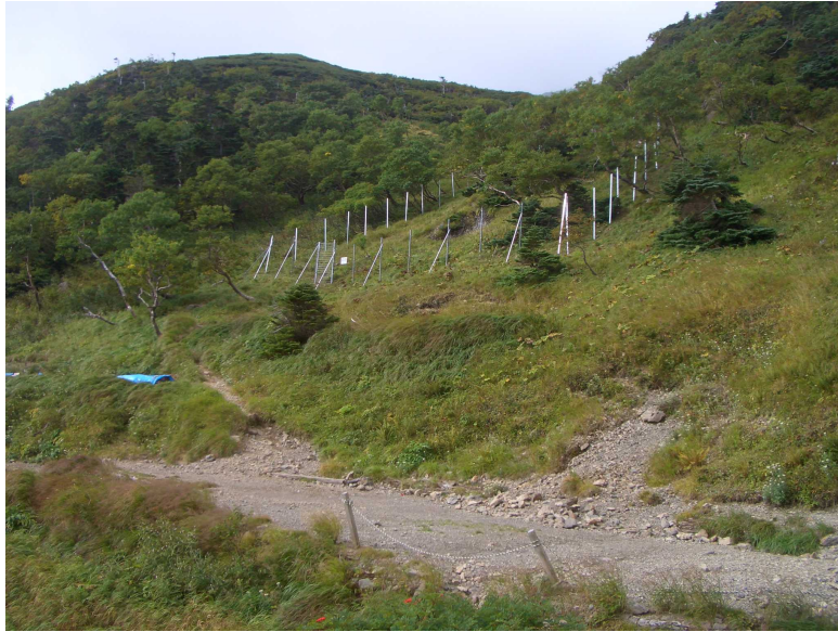
写真3 茶臼の防鹿柵