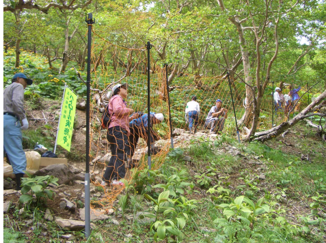
写真4 馬の背の防鹿柵